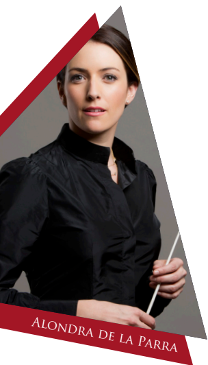
ALONDRA DE LA PARRA